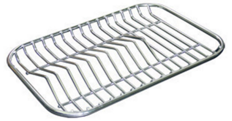
不锈钢背板 8100 280